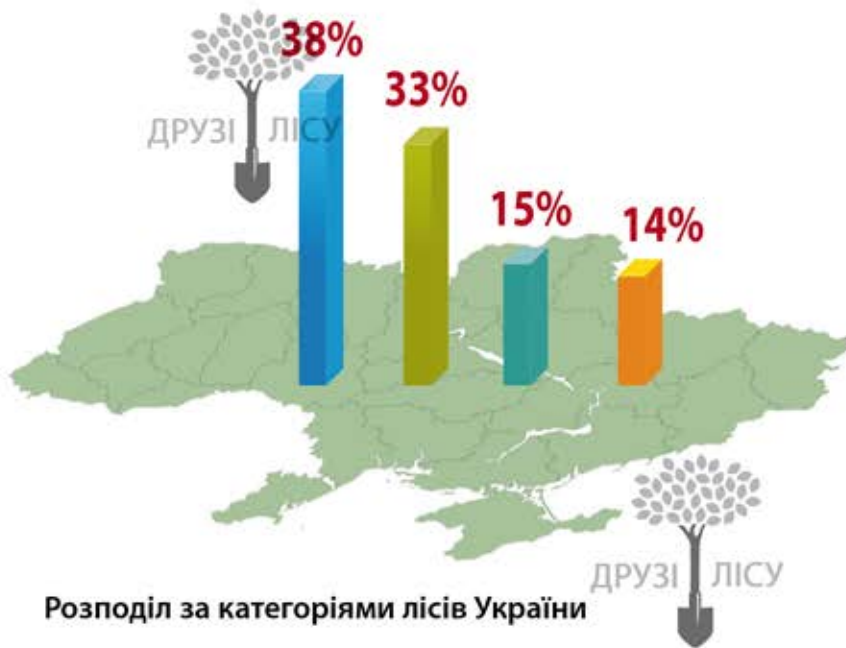
Розподіл за категоріями лісів України

Залежно від функції, ліси в Україні, відповідно до Лісового кодексу, поділені на 4 категорії: господарські, рекреаційно-оздоровчі, ліси природоохоронного, наукового, історико-культурного призначення та захисні ліси. Загалом по Україні найбільша категорія – це господарські ліси – їх 38%. На другому місці за кількістю – захисні ліси – їхня частка 33% від загальної кількості лісів в країні. Рекреаційно-оздоровчих лісів у нас 15%, а лісів природоохоронного наукового, історико-культурного призначення – 14%.